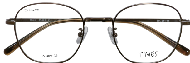
C-2 シャーリングコーヒブラウン