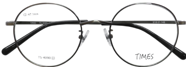
C-3 シャーリングアンティークグレー