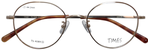
C-1 シャーリングゴールド